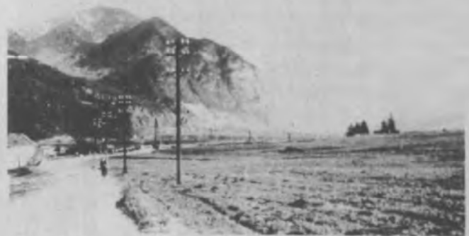
Die alte Salzstraße nach Hatting, noch nicht asphaltiert (um 1950)

Von 66 Flurnamen, die es vor der Grundzusammenlegung im Talboden von In-