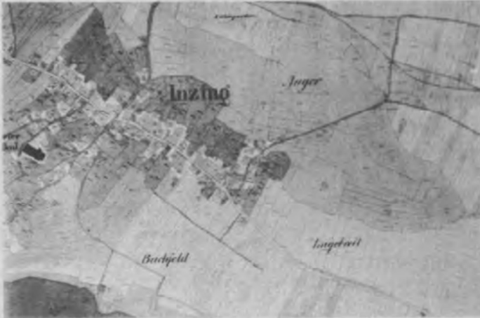
Flurnamen: Inzing vor der Grundzusammenlegung

Bei der Ausstellung „der Museumsverein stellt sich vor“ im Juni dieses Jahres