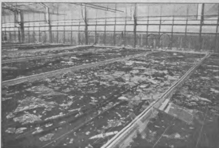
Der Scherbenhaufen in der Gärtnerei Kirchmair

Während sich die Schäden auf den Feldern einigermaßen in Grenzen hielten, waren jene an Gebäuden und Fahrzeugen viel größer. Besonders arg traf es die beiden Gärtnereien Kirchmair und Griessmaier, denen durch diesen Bombardement aus den