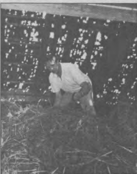
Das durchsiebte Dach des Neuwirts Fredy

Als man nach dem Unwetter daran ging, die Schäden festzustellen, da wußten die Betroffenen noch nicht, daß dieser Hagelschlag der teuerste in unserer Gegend seit Menschengedenken war. Er geht wohl in die zig Millionen, wobei allein die Neudeckung der Kirche an die 3 Mill. Schilling verschlingen wird. Dabei sind aber gar nicht alle entstandenen Schäden in der Gesamtsumme enthalten, weil ja nicht alle betroffenen Gebäude gegen Sturm versichert sind. Mit der Neudeckung des Kirchendaches wurden die beiden Firmen Wolfgang Wurzer und Chri-